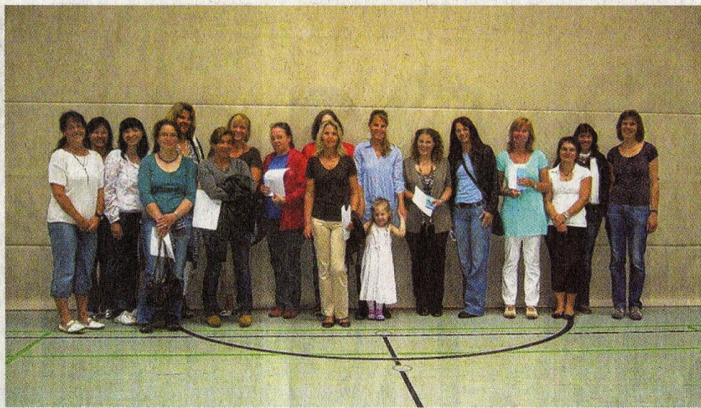
Schüler der Grundschule Großaitingen haben sich bei den Lesemamas und den Büchereifrauen für deren Engagement im vergangenen Schuljahr bedankt.